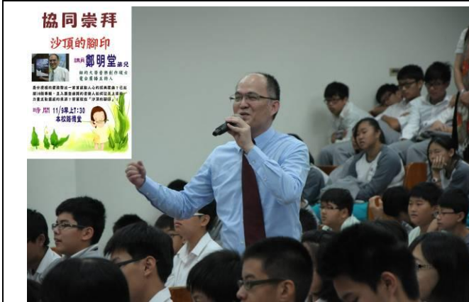
標題：生命教育講座－鄭明堂 說明：入圍金曲獎的音樂人分享創作靈感的泉源