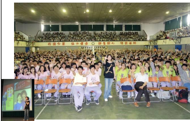
標題：生命教育講座－Dore 媽咪 說明：分享 Dore 的生命禮物