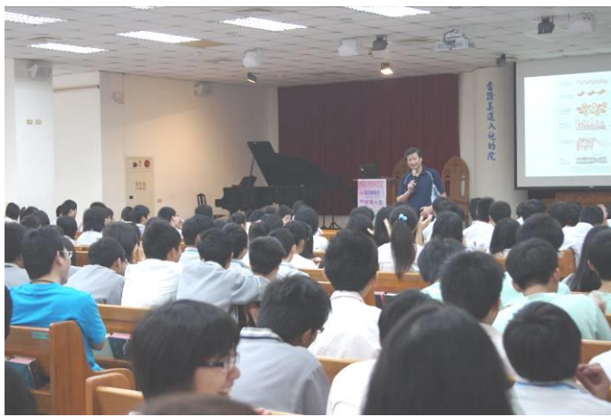
標題：生命教育講座—張南驥教授 說明：核爆人生之幹細胞的奧秘