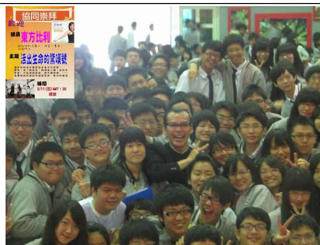
標題：生命教育講座—東方比利 說明：活出生命的驚嘆號